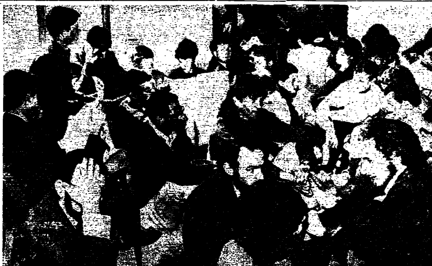
بعض طلبة جامعة كيب تاون في جنوب أفريقيا ينظرون اضراب جالوس في قسم ادارة الجامعة. وقد اعتقلواهم سيمسترون في هذا الاضراب حتى يتخذ اجراء اداري لاعادة تعيين استاذة افريقي كان قد فصل من عمله في الجامعة «صورة لكونالديس»

لندن - رويتر - اظهرت تحقيق هنا ان النساء اللواتي يدخن بانتظام خلال فترة الحمل قد يلدن اطفالا اصغر حجما من اطفال غيرهن. وقد تم الوصول الى هذا الاستنتاج بعد مراقبة حوالي